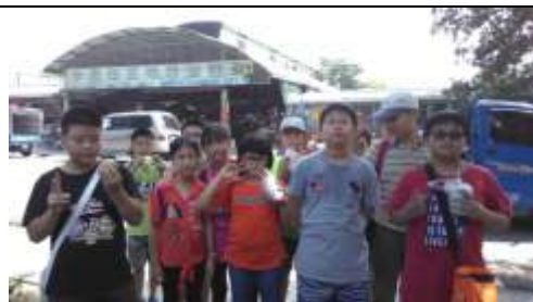
(中興新村街道巡禮)