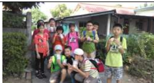
(中興新村街道巡禮)