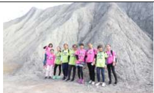
(月世界進行地質校外教學研究)