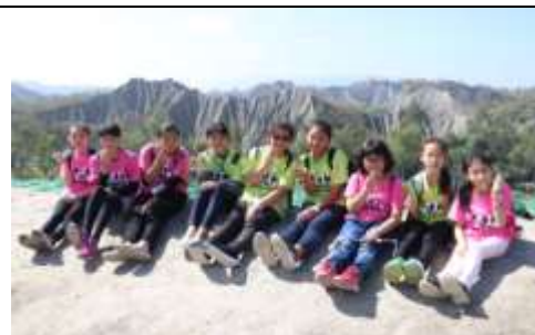
(月世界進行地質校外教學研究)