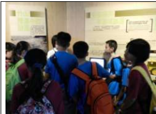
(前往地震園區進行校外教學研究)