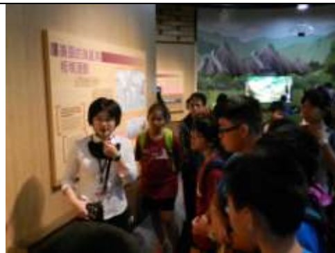
(前往地震園區進行校外教學研究)