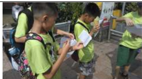
(地圖判讀練習/搭車前往科博館)