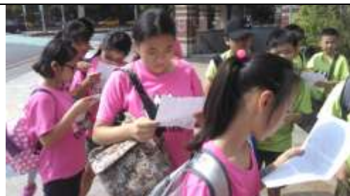
(地圖判讀練習/搭車前往科博館)